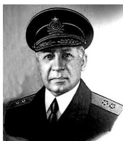
Рис. 2. Вице-адмирал Л. Е. Гончаров. 1940-е гг

нявшийся на эскадренных миноносцах типа «Новик», а в 1920-е гг. развил основополагающие принципы боевого использования тяжёлых артиллерийских кораблей и связанные с этим требования к их конструкции и вооружению. Эта незаменимость спасала его от расстрела. Но не от арестов. В дальнейшем Л. Е. Гончаров был репрессирован ещё дважды, в 1930 г. и в 1947 г. Последний арест закончился его преждевременной кончиной.