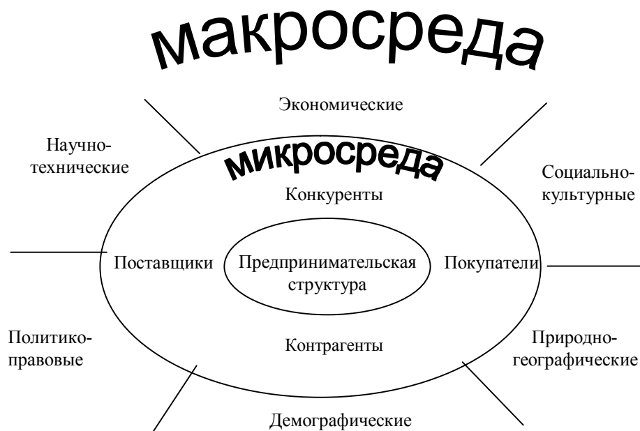
Рис. 1. Графическая модель предпринимательской среды

На рис. 1 представлена графическая модель предпринимательской среды. Ядром предпринимательской среды является предпринимательская структура с присущей ей внутренней средой. Совокупность предпринимательских структур, осуществляющих свою деятельность в определенной сфере, составляет основу соответствующей сферы предпринимательства.