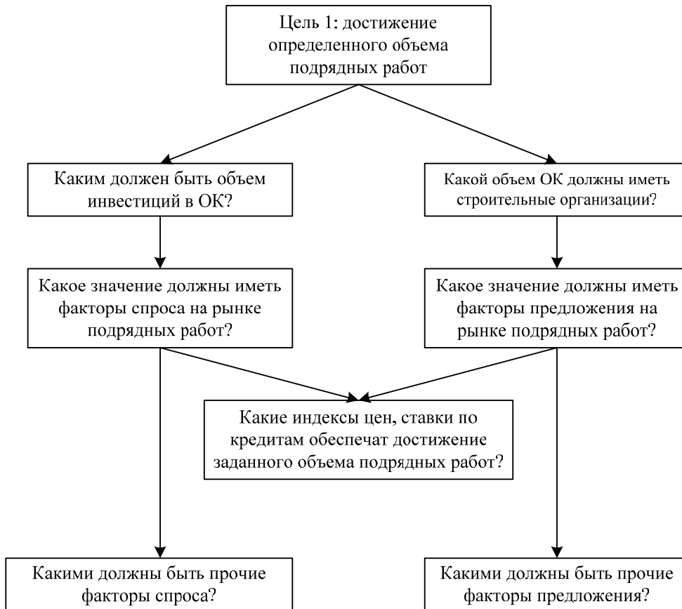
Разложение цели стратегического планирования ИСД на задачи

Рост объема работ по виду деятельности «Строительство» V обеспечивается за счет роста объема основного капитала в строительстве O_C и роста объема инвестиций в ОК экономики. Рост объема работ по виду деятельности «Строительство» V обуславливает рост собственных финансовых ресурсов строительных организаций, который отражается показателем сальдированного финансового результата S_C . Его увеличение позволяет повысить темпы роста инвестиций в ОК строительства I_C , что приведет к росту объема основного капитала в строительстве O_C . Указанным зависимостям соответствует контур (1):