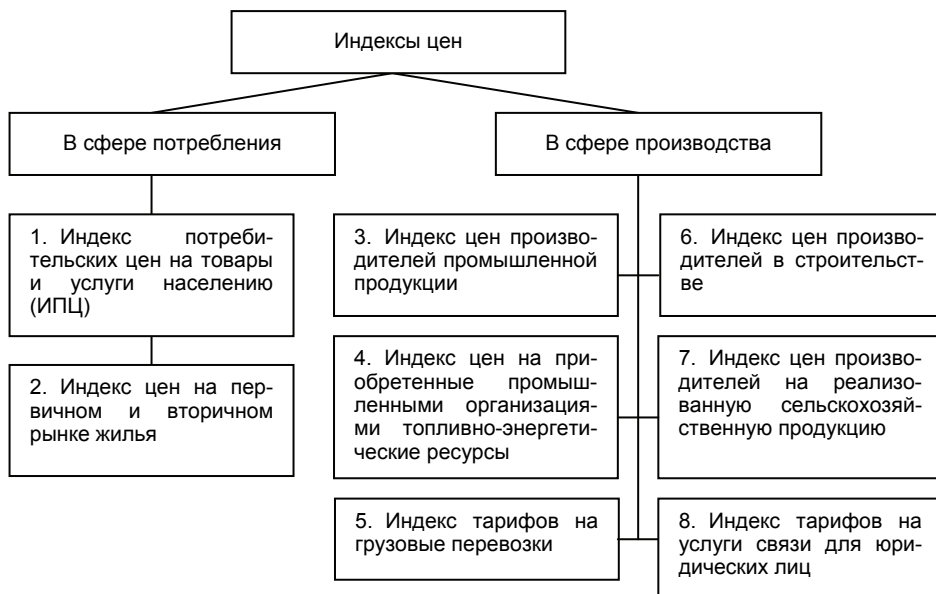
Рис. 1. Система агрегатных индексов цен

Потребительская корзина ИПЦ состоит из специально отобранной совокупности товаров и услуг массового потребительского спроса. Она включает в себя три группы благ: продовольственные товары, непродовольственные товары и платные услуги населению. Их общее число в корзине российского ИПЦ составляет около 400 наименований.